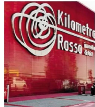
Cysero promosso dal Km Rosso